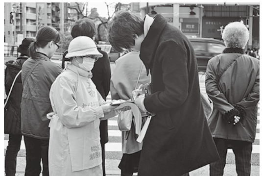
巣鴨駅前の宣伝=11月24日

5月までの「2つの署名、地元国会議員、地方議会要請の活動強化期間」を年初から出足早く取り組みましょう(署名は「消費税10%中止・減税を」と「安倍改憲NO 全国3千万人署名」)。