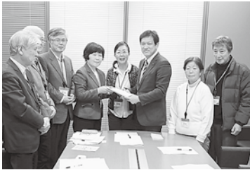
日本共産党、宮本衆院議員(右から3人目)に署名を渡す