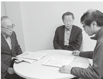
社会民主党、増田局長(右端)に要請