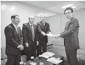
民進党、田鹿部長(右)に要請